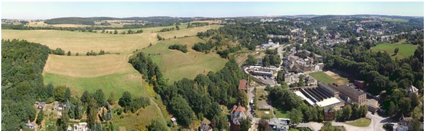
Das Foto zeigt einen 360-Grad-Blick vom Fesselballon an der Göltzschtalbrücke auf Teile Netzschkaus.