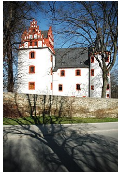
Das Schloss Netzschkau