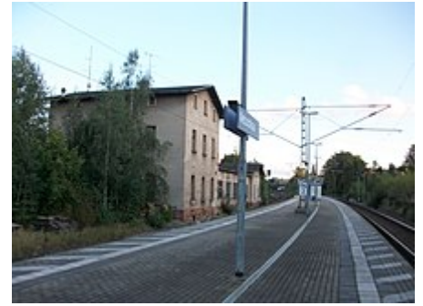
Haltepunkt Netzschkau, Blick Richtung Plauen (2017)

Zu DDR-Zeiten war in der Stadt der VEB Nema Netzschkau angesiedelt, der 1889 als Maschinenbauwerkstatt „Hofmann und Stark“ gegründet worden war und ab 1899 als „Netzschkauer Maschinenfabrik Franz Stark & Söhne“ firmierte. Nach der Wende wurden die Unternehmensteile verkauft und schließlich abgewickelt [12] . In Netzschkau ist der Geschäftsbereich Lithodecor der Firma DAW SE ansässig.