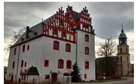
Schlosskirche und Schloss

Unweit des Schlosses steht die Schlosskirche der Evangelisch-Lutherischen Kirchgemeinde. Das im Stil des Klassizismus erbaute Gotteshaus war Nachfolgerin einer Kapelle, die sich bis zu deren Verfall im Schlossareal befand. Als einer der wenigen Kunstschätze aus jener Kapelle konnte eine Predella gerettet werden, die das letzte Abendmahl Jesu darstellt. Diese Alabasterplastik im Halbreief wurde durch den Schneeberger Bildhauer Böhme dem in der dortigen St.-Wolgangs-Kirche befindlichen Cranach-Altar nachempfunden und ähnelt dem Vorbild bis in die Gesichtszüge hinein.