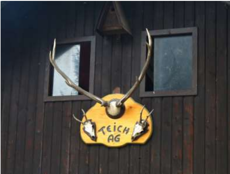
Verziertes Geweih an der Front des Vereinshauses der Teich AG am Rietschen-Teich bei Regnitzlosau

Einen Artikel über die Auszeichnung „Kulturgut Teich“, die dem Rietsch-Teich im letzten Jahr zuteil geworden ist, findet man unter