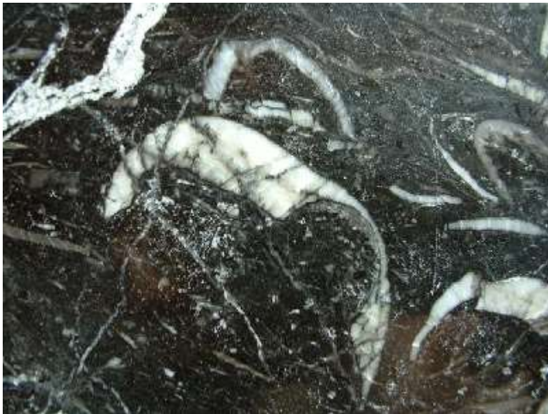
Schalen von Productus sp. in Kohlenkalk von Trogenau.

http://images.google.de/imgres?imgurl=http%3A%2F%2Fwww.botanischer-garten-hof.de%2Fpicture%2Fsteingarten-kohlenkalk-IMG_1986.jpg&imgrefurl=http%3A%2F%2Fwww.botanischer-garten-hof.de%2Fsteingarten-kohlenkalk.html&h=667&w=1000&tbnid=fui8JbPrwQOxJM%3A&docid=abhvyeGxNCLS4M&ei=hGrkVvGdDcezPJOuh6gB&tbn=isch&iact=rc&uact=3&dur=574&page=1&start=0&ndsp=46&ved=0ahUKEwjx77_S7bvLAhXHGQ8KHRPXARUQrQMIJzAD