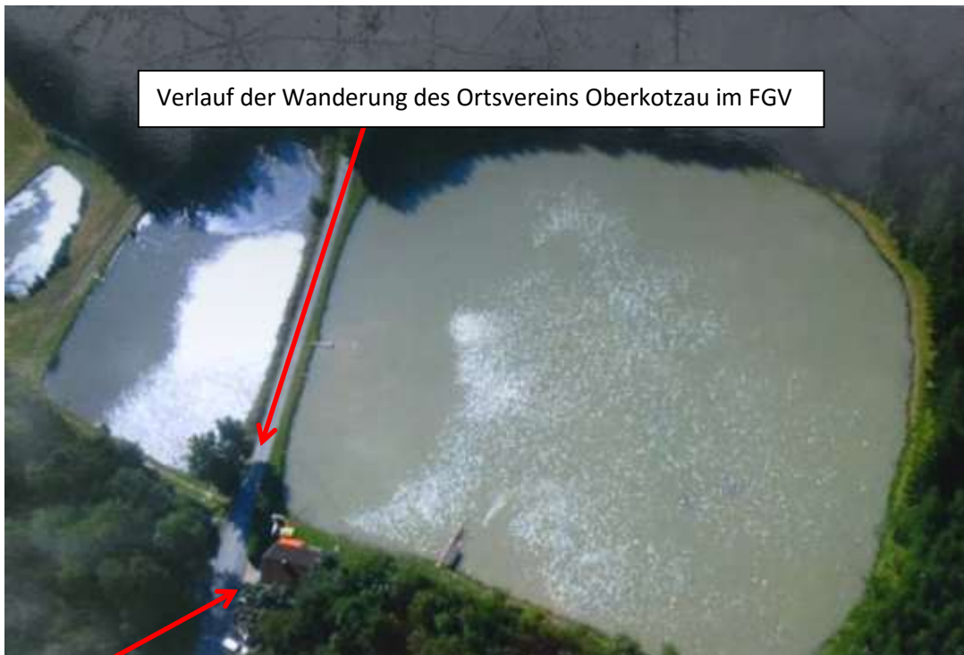
Verlauf der Wanderung des Ortsvereins Oberkotzau im FGV

Auf einer Info-Tafel unmittelbar neben dem Teich kann man weitere Informationen über diese Anlage bekommen