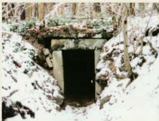
Das Foto zeigt den Schaukeller vor der Renovierung.

Zwischen Sandbergweg und Brunnenröhrenweg, auf der Südwestseite des Rauhen Kulms, gibt es 15 Gemeinschaftskeller, die sich innen mehrfach teilen. Die in einem Türstock eingeritzte Zahl 1712 stellt den ältesten Hinweis auf das Entstehungsjahr der Keller dar. Nach Aufgabe der gemeinschaftlichen Brauerei kurz vor dem 1. Weltkrieg wurden v.a. Kartoffeln und Rüben eingelagert. Die ortsansässigen Gastwirte nutzten die Keller aber bis in die 1950er Jahre als Bierkeller weiter. Während des 2. Weltkriegs dienten die Keller als Luftschutzräume, daher wurden zwischen ihnen Fluchtverbindungen geschaffen.