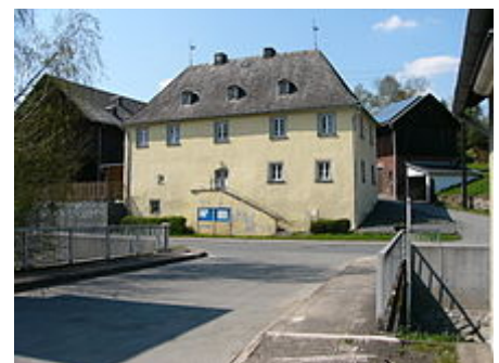
Standort des ehemaligen herrschaftlichen Verwaltungssitzes