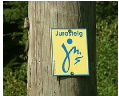
Markierung des Jurasteigs

Wikipedia® ist eine eingetragene Marke der Wikimedia Foundation Inc.