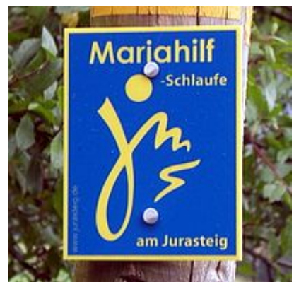
Bezeichnung der Mariahilf-Schlaufe