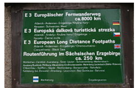
Wegweiser in Jägerhaus

Abgerufen von „ https://de.wikipedia.org/w/index.php?title=Europäischer_Fernwanderweg_E3&oldid=186272398 “