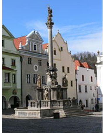
Mariensäule in Český Krumlov

Die Pestsäule ist der Muttergottes gewidmet, die als Mondsichelmadonna mit Kind auf einer hohen korinthischen Säule aufgestellt ist. Am Sockel sind wichtige Heilige des Böhmisches Königreichs dargestellt. Der umgebende Brunnen wurde erstmals in der von Johann I. von Rosenberg erlassenen Brandschutz- und Polizeiordnung vom April 1388 erwähnt. [2]