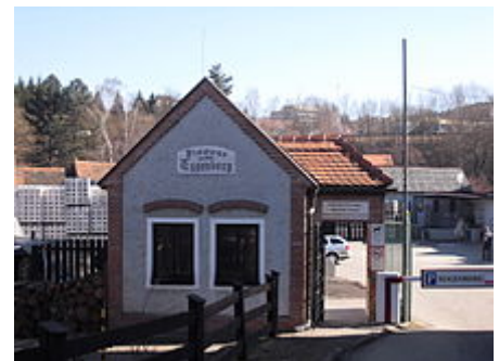
Die Einfahrt zur Brauerei