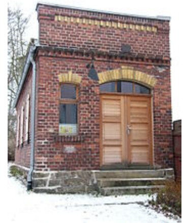
Gedenkstätte Langer Gang