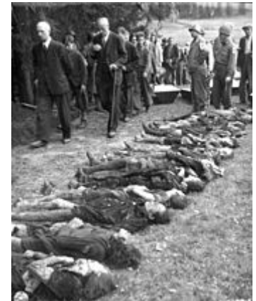
Deutsche Zivilisten werden am 11. Mai 1945 in Volary von US-Militär zum Vorbeigehen an Opfern eines Todesmarsches gezwungen

Am 25. April 1945 wurde die Grenze zum damaligen „Protektorat Böhmen und Mähren“ überschritten. Im Protektoratsgebiet wurden größere Ortschaften noch mehr gemieden, da die tschechische Bevölkerung von den Untaten der SS wusste und dem Wachpersonal daher zunehmend Schwierigkeiten bereitete. Weiter ging es durch Mraken nach Maxberg. Wegen des großen Tumults der ausgehungerten Frauen wurde ihnen dort das Essen verweigert. Hinter Neumark und Plöß befanden sich die Marschierenden wieder auf dem Gebiet des Deutschen Reichs. Weiter ging es durch Chudiwa, Neuern, Leschowitz, Olchowitz/Depoldowitz, Dorrstadt, Jenewelt und Seewiesen. Den noch gehfähigen Gefangenen wurde durch die Höhenunterschiede im Böhmerwald immer mehr Leistung abverlangt. Nach dem Passieren von Althütten, Hartmanitz/Oberkörnsalz und Unterreichenstein kam der Zug am 1. Mai 1945 in Außergefeld an, wo die Häftlinge in Baracken eines Sägewerks untergebracht wurden. Am kommenden Morgen brachen die Überlebenden nach Ferchenhaid und Filz auf, wo sie eine weitere Nacht in Scheunen verbrachten. Am 3. Mai erreichten sie nach Elendbachl, Mitterberg, Obermoldau und Eleonorenhain schlussendlich Wallern. Dort