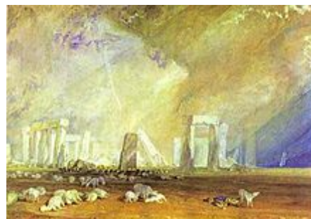
Gemälde von William Turner (1828)

Die erste der drei Abbildungen zeigt die Anlage in einer Panoramaansicht – perspektivisch allerdings zu einem Rechteck verzerrt; die zweite illustriert die Errichtung der Anlage durch den Zauberer Merlin und zeigt, wie er einen der Decksteine auf zwei Tragsteine hebt. Die dritte Abbildung wurde im Jahre 2007 wiederentdeckt und stammt aus dem Geschichtswerk Compilatio de Gestis , das vermutlich um 1441 niedergeschrieben wurde. [33] Der diese Illustration begleitende Text bezieht sich ebenfalls auf die Errichtung der Anlage durch den Zauberer Merlin.