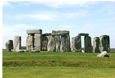
Stonehenge im Juli 2008