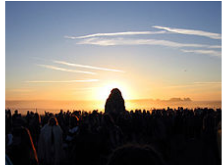
Sonnenaufgang hinter dem Fersenstein