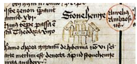
Mittelalterliche Zeichnung Stonehenges, 1441

In der jüngeren Vergangenheit wurde Stonehenge durch die unmittelbare Nähe zweier stark befahrener Straßen (die Hauptstraße A303 zwischen Amesbury und Winterbourne Stoke sowie die unmittelbar am Monument vorbeiführende A344) beeinflusst. Es gab immer wieder verschiedene Vorschläge, die Straßen zu verlegen oder zu untertunneln. Seit den 1950er Jahren wurden immer wieder Vorschläge gemacht, die Situation für den Schutz der Anlage und für die Besucher zu verbessern.