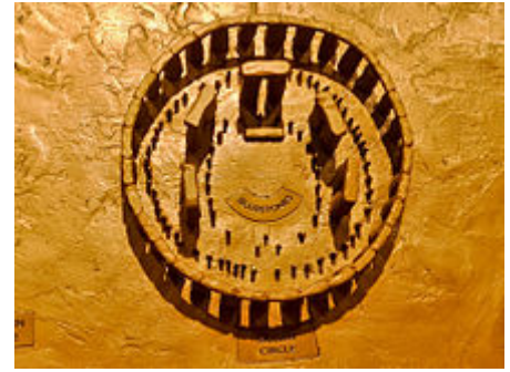
Rekonstruktion der Phase 3 V als Modell im Museum von Stonehenge

Etwa 1700 v. Chr. wurden zwei weitere Ringe von Lochgrabungen etwas außerhalb des Sarsen-Kreises angelegt, in Ergänzung zu dem Kreis der Aubrey-Löcher , die sich gegenüber an der Binnenperipherie des Ringwalls finden. Die neuen Kreise werden als Y- und Z-Löcher bezeichnet (11 und 12). Ihre 30 beziehungsweise 29 Löcher waren nie mit Steinen besetzt, sonst hätten sich in ihnen aufgrund des Drucks, den die Steine ausüben, Bodenverdichtungen feststellen lassen. Das Monument von Stonehenge scheint darauf um 1600 bis 1400 v. Chr. aufgegeben worden zu sein, möglicherweise im Zusammenhang des Unterganges oder der Verdrängung der Kultur seiner Schöpfer durch eine nachfolgende. Die Löcher füllten sich in den nächsten Jahrhunderten, die obersten Schichten dieses Materials stammen aus der Eisenzeit.