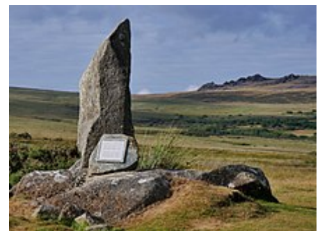
Blaustein-Monument unter dem Blausteinsteinbruch auf dem Carn Menyn, Preseli Berge (im Hintergrund)