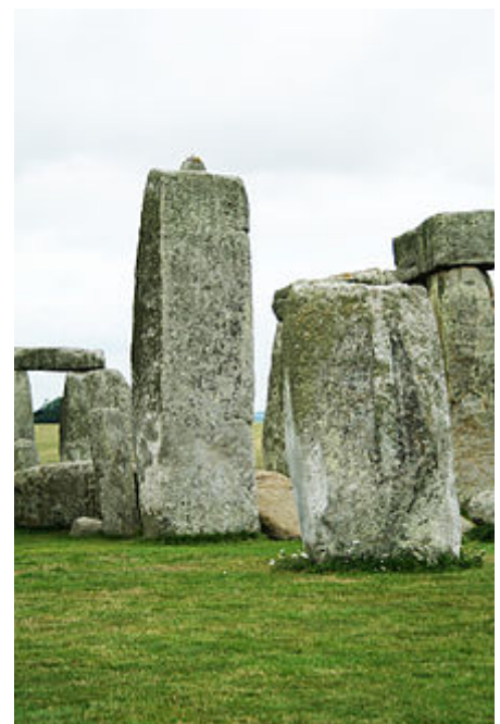
Tragstein mit Zapfen