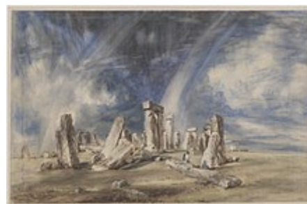
Aquarell von John Constable (1835)

Die erste realistische Darstellung führte der holländische Künstler Lucas de Heere (1534–1584) als Aquarell zur Illustration seines 1573 bis 1575 handschriftlich niedergelegten Berichtes Corte Beschryving van England, Scotland ende Irland aus. Das Bild zeigt den Steinkreis von erhöhter Position aus nordwestlicher Richtung. Die menschliche Figur in der Mitte des Bildes lehnt sich an den Tragstein Nr. 60. Ein lediglich mit den Initialen „R.F.“ signierter Stich aus dem Jahr 1575 und ein aus dem Jahr 1588 stammendes Aquarell von William Smith in dem Manuskript Particular Description of England zeigen die Anlage aus ähnlicher Ansicht wie de Heeres Aquarell. Vermutlich liegt allen drei Bildern die gleiche, unbekannte Vorlage zugrunde. Der nur mit „R.F.“ signierte Stich war im Jahre 1600 das Vorbild für eine Stonehenge-Illustration in dem altertumkundlichen Buch Britannia von William Camden (1551–1623). Die Illustration war ihrerseits Vorbild für weitere Bilder von Stonehenge.