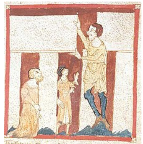
Die Errichtung Stonehenges durch einen Riesen mit Unterstützung von Merlin. Die früheste bekannte Abbildung von Stonehenge im Waces Roman de Brut aus dem 2. Viertel des 14. Jahrhunderts.

Um das Jahr 1580 schließt der Altertumsforscher William Lambarde erstmals eine übernatürliche Entstehung der Anlage aus, indem er beobachtet, dass bei der Errichtung des Steinkreises Zimmermannstechniken auf die Steinbauweise Stonehenges übertragen wurden. Zudem erkennt er als erster, dass die Steine nicht wie früher geschildert von Merlin mit Hilfe von Zauberei aus Irland herangeschafft wurden, sondern aus der Region Marlborough stammen.