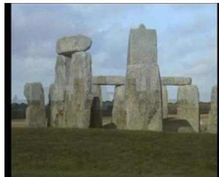
Mediendatei abspielen Videoclip: Impressionen von Stonehenge

Die nichtwissenschaftliche Literatur um Stonehenge im 20. Jahrhundert ist erheblich reichhaltiger und wird vor allem von historischen Romanen dominiert. Zu nennen sind aus der mittlerweile fast unüberschaubaren Zahl der Veröffentlichungen zum Beispiel der 1985 erschienene Roman Pillar of the Sky von Cecelia Holland, der 1995 erschienene Roman Die Druiden von Stonehenge von Wolfgang Hohlbein oder der 2001 in Deutschland erschienene Roman Stonehenge von Bernard Cornwell. Aber auch Familiensagas, Horror-, Fantasy- und sogar Kriminalromane greifen Stonehenge als mehr oder weniger dominierenden Teil ihrer Handlung auf. John Cowper Powys verbindet in seinem Monumentalwerk über das Leben in den 1920er Jahren Glastonbury Romance Legenden um den Heiligen Gral und den Arthus-Mythos in einer Episode mit Stonehenge.