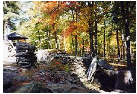
America's Stonehenge in New Hampshire