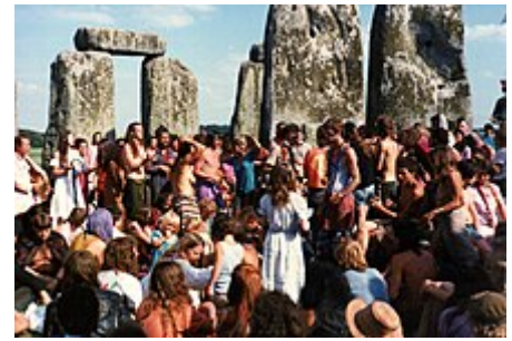
Letztmaliges Stonehenge Free Festival im Jahre 1984

Mit der Wiederentdeckung und Verbreitung der klassischen Literatur entstand nach der Renaissance zunehmendes Interesse an den Druiden, die in den alten Texten erwähnt werden. Da die wissenschaftliche Erkundung der Vorgeschichte noch in den Anfängen steckte, wurde Stonehenge als vorrömischer Tempel den Druiden zugeordnet. Diese irrtümliche Verknüpfung ist immer noch einflussreich. Im Jahre 1781 hatte der Engländer Henry Hurle eine Geheimgesellschaft namens Ancient Order of Druids gegründet. Obwohl das Interesse an Druiden in der Mitte des 19. Jahrhunderts nachließ, blieben die entstandenen religiösen Ordensgemeinschaften weiter bestehen. Ihre Ausflüge nach Stonehenge lockten stets auch Schaulustige an. Ein markantes Beispiel ist die Zeremonie des Ancient Order of Druids im August des Jahres 1905, als sich 700 Mitglieder dieses Ordens in Stonehenge versammelten und feierlich 256 Anwärter in ihren Orden aufnahmen. Heute bilden die neuzeitlichen Druiden einen Teil der neureligiösen Landschaft, speziell des Neopaganismus. Sie treffen sich regelmäßig in Stonehenge und halten dort ihre Zeremonien ab.