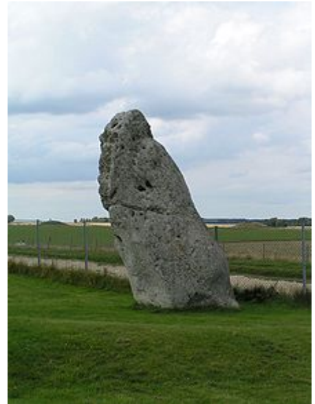
Heel-Stein / Fersenstein