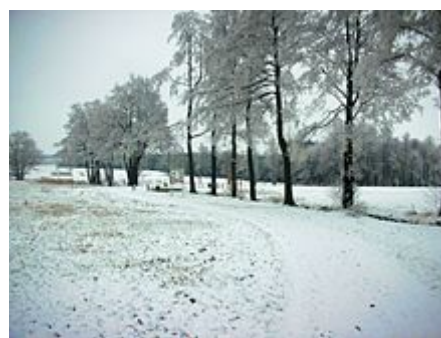
Anlage im Winter

Der Stein befindet sich an der Stelle, wo die Gemarkungen Münchenreuth (Gemeinde Feilitzsch , Landkreis Hof , Bayern), Grobau (Gemeinde Weischlitz , Vogtlandkreis ,