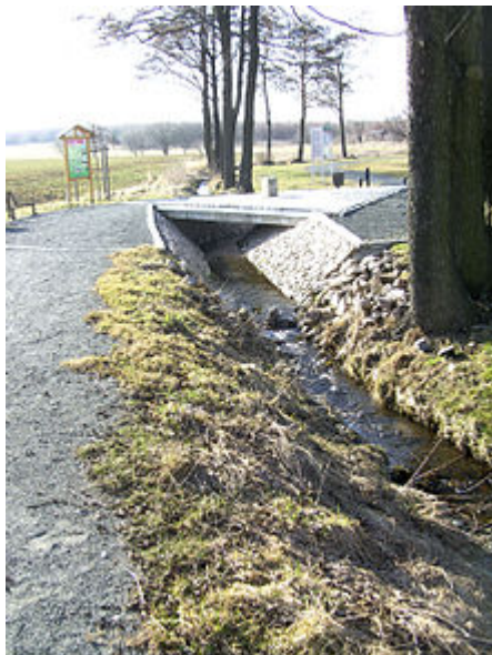
Der Drei-Freistaaten-Stein über dem Lauf des Kupferbachs

Koordinaten: 50° 25′ 27,6″ N , 11° 55′ 13,3″ O